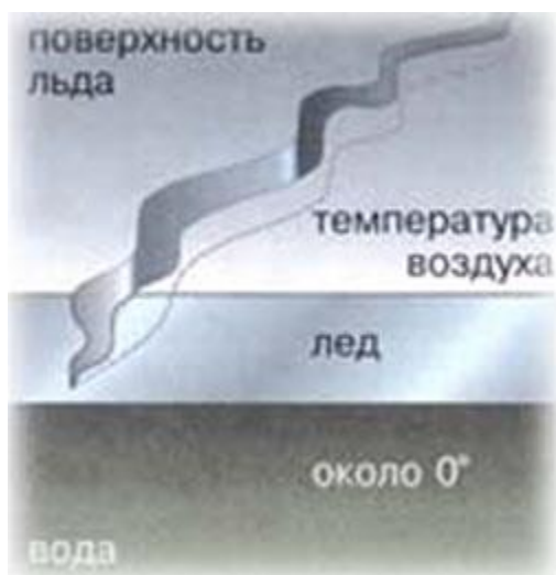
Рис.1. Разлом на поверхности льда, вызванный его температурной деформацией.

Однако хаотичность трещин на поверхности льда только кажущаяся, если помнить о механизме льдообразования: прежде всего в начале зимы, когда лед еще не везде одинаков по толщине, напряжения проявляются по границам стыковки толстого и тонкого ледового покрова, то есть там, где мелководье резко переходит в глубину. При этом глубокая сторона водоема будет определяться по близко располагающейся к обычно крутому берегу трещине, и наоборот.