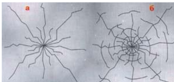
Рис.4. Типы растрескиваний льда под нагрузкой: а – радиальные трещины, не ведущие к провалу груза; б – радиальные трещины, сопровождаемые концентрическими разрушениями, ведут к быстрому провалу груза.

Об упругих свойствах льда говорят следующие количественные данные. Если рассматривать прозрачный, наиболее прочный лед, то при центральном прогибе его в 5 см трещин на нем не образуется; прогиб в 9 см ведет к усиленному образованию трещин, прогиб в 12 см вызывает сквозное растрескивание, при 15 см лед проваливается. Трещины под действием нагрузок возникают двух типов: радиальные (рис.4-а) и концентрические (рис.4-б).